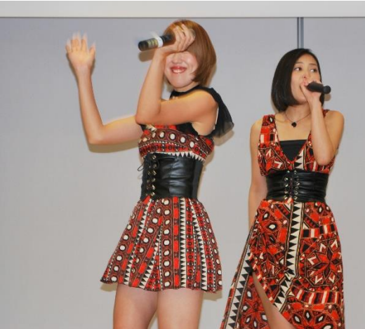
福岡大学電子（現・電子情報）工学科創設五十周年